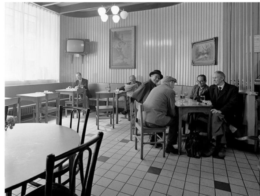
En ölhall i Stockholm på 1940 talet. Mellan 1940 - 1950 så fanns det omkring 400 ölkafeer / Ölhallar i Stockholm.

För oss är valet enkelt. Vi vill bygga Ölhallar i Sverige!